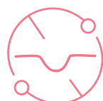
Redukcja zmarszczek głębokich