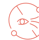
Redukcja zmarszczek długich