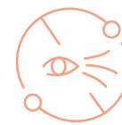
Redukcja zmarszczek długich