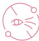
Redukcja zmarszczek długich