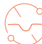
Redukcja zmarszczek głębokich