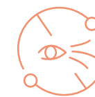
Redukcja zmarszczek długich