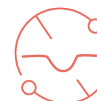
Redukcja zmarszczek głębokich